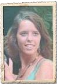
Kinkajou : 0479/68.58.61