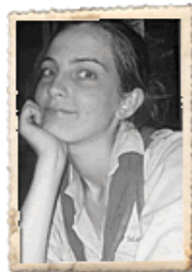
Taïgan : 0476/09.89.35