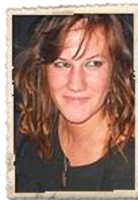
Shagya : 0472/93.27.40